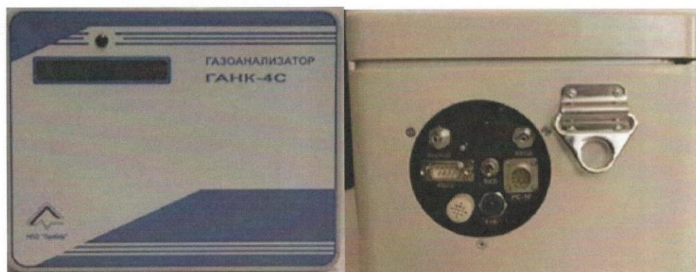
Рисунок 2 - Общий вид газоанализатора ГАНК-4С