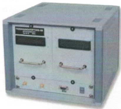
Рисунок 3.1 - Общий вид газоанализатора ГАНК-4М (исполнение 1)