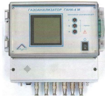
Рисунок 3.2 - Общий вид газоанализатора ГАНК-4М (исполнение 2)