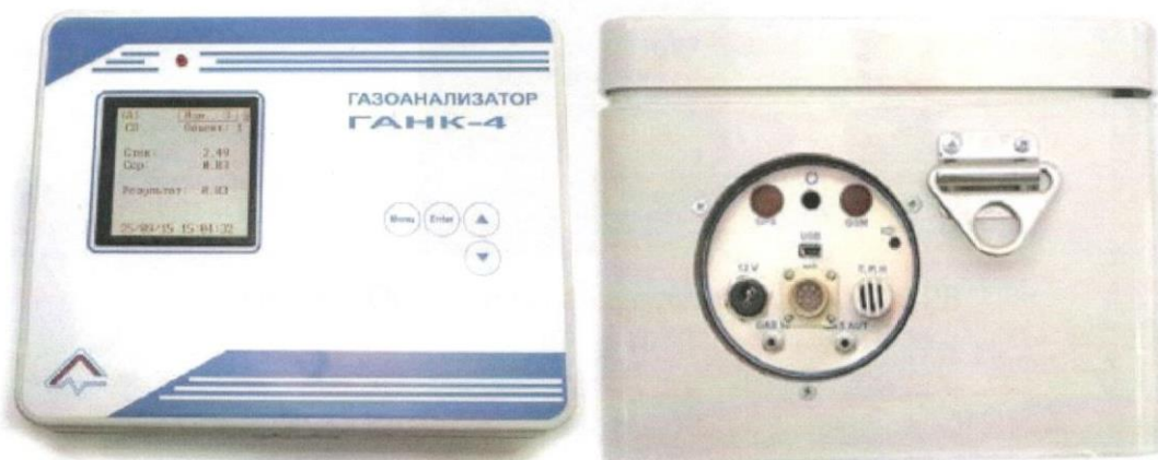
Рисунок 1 - Общий вид газоанализаторов ГАНК-4АР, ГАНК-4А, ГАНК-4Р

Внешние виды газоанализаторов различных модификаций приведены на рисунках 1-5. Газоанализатор ГАНК-4М выпускается в корпусах разных исполнений (рисунки 3.1, 3.2).