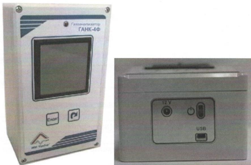
Рисунок 5 - Общий вид газоанализатора ГАНК-4Ф