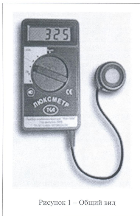
Рисунок 1 – Общий вид